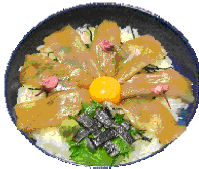
サワラ丼 1,260円 (汁・漬物付)