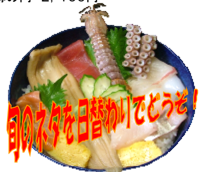
海鮮丼 1,260円 (汁・漬物付)