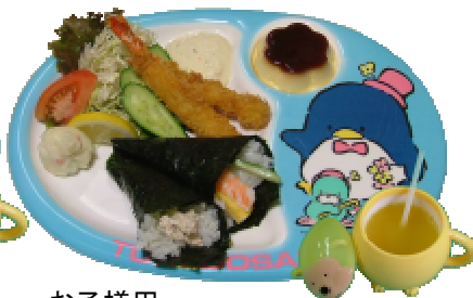
お子様用 エビフライセット 840円