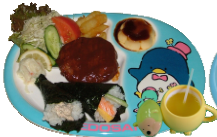
お子様用 ハンバーグセット 840円