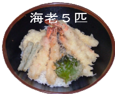
スペシャル海老天丼 1,050円 (汁・漬物付)