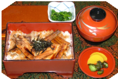
蒸又は焼穴子重 1,050円